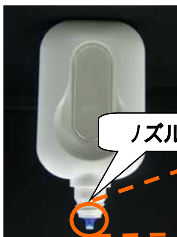
東芝燃料カートリッジ