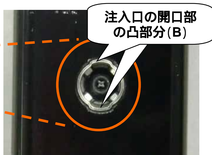
燃料注入口の拡大写真