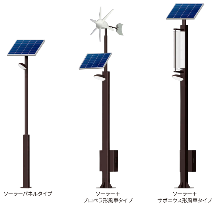
ソーラーパネルタイプ