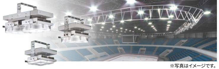
※写真はイメージです。

軽量タイプへのモデルチェンジで軽量化と効率アップを実現。器具本体はグレー色へ。アリーナなどの広いフロアもタブレット一つで調光制御も操作も可能。